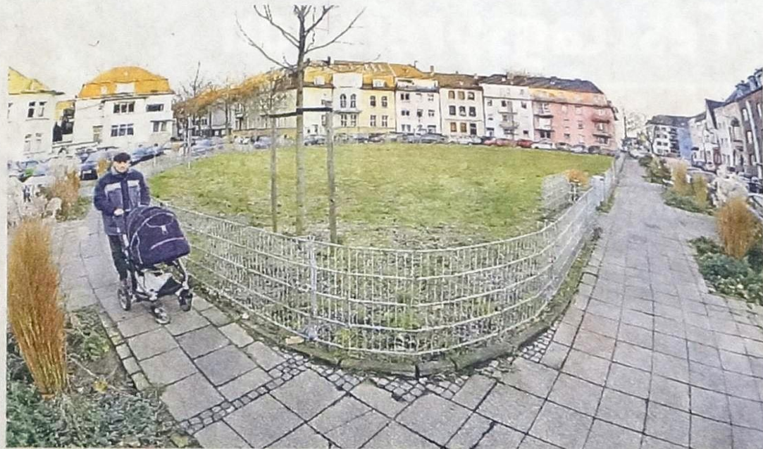
Der Von-Beckerath-Platz soll im nächsten Frühjahr dank der Unterstützung der Bürger wieder blühen.

Im Frühjahr 2014 wurde mit dem Von-Beckerath-Platz der erste derart begrünte Platz in der Innenstadt geschaffen. Er soll das Leben dort lebenswerter gestalten und einen Bereich für Insekten und Vögel bieten. Der eingezäunte Platz wird also wieder richtig schön. Die Bank lädt zum Verweilen ein. Und das ist noch nicht alles: Die Von-Beckerath-Straße bekommt neue Bäume.